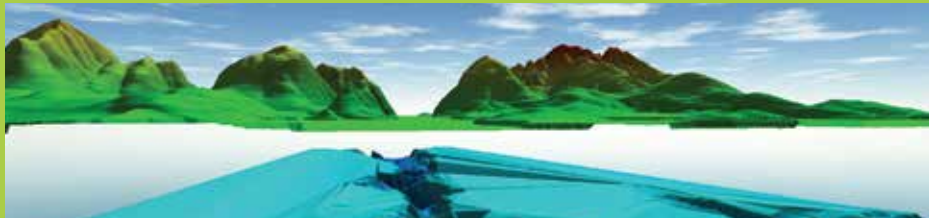
Mostrando múltiplas superfícies simultaneamente no visualizador 3D.

O poderoso visualizador 3D do Global Mapper permite que qualquer dado 3D, inclusive nuvem de pontos LiDAR, modelo de elevação digital, e feições vetoriais 3D sejam restituídos tridimensionalmente de forma espetacular. A vista oblíqua assim criada oferece uma perspectiva única, com a opção de tela inteira ou em compartilhamento com a vista 2D correspondente ao lado. O resultado por ser exportado para arquivo de imagem ou gravado num vídeo de sobrevoo.